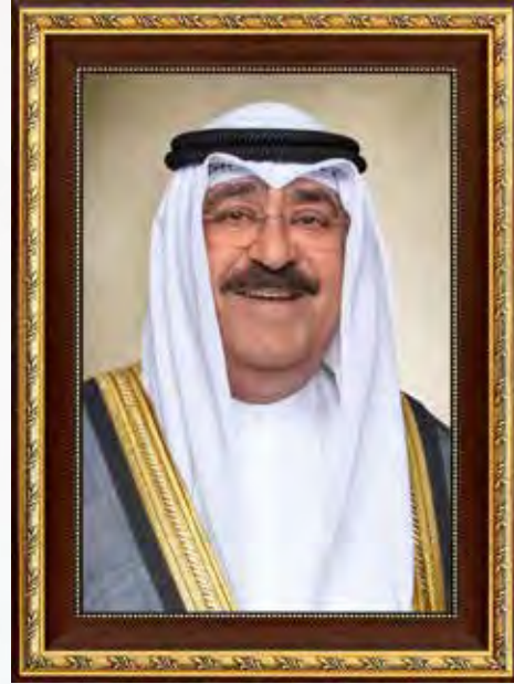
صَاحِبِ السُّمُو الشَّيْخِ مَسْجِدِ الْاِحْمَدِ الْجَابِرِ الصَّبَّاحِ اَمِيْرَ دَوْلَةِ الْكُوَيْتِ