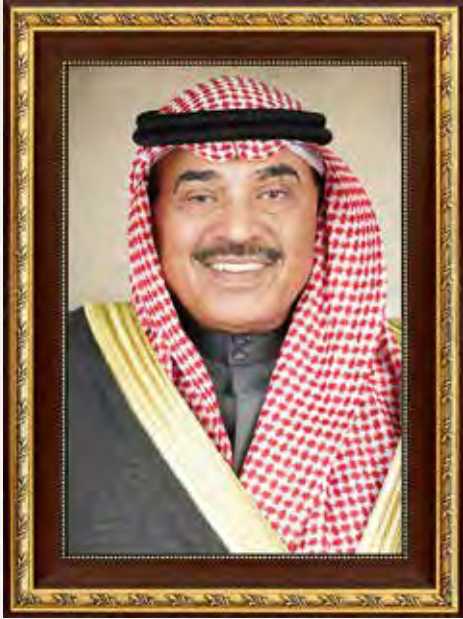
سَمُو الشَّيْخِ صَبَّاحُ الْخَالِدِ الْجَبْرِ الصَّبَّاحِ وَلِيَّ عَهْدِ دَوْلَةِ الْكُوَيْتِ