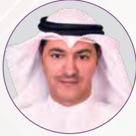
أ. مساعد قنيفذ الوعلان عضو مجلس الإدارة