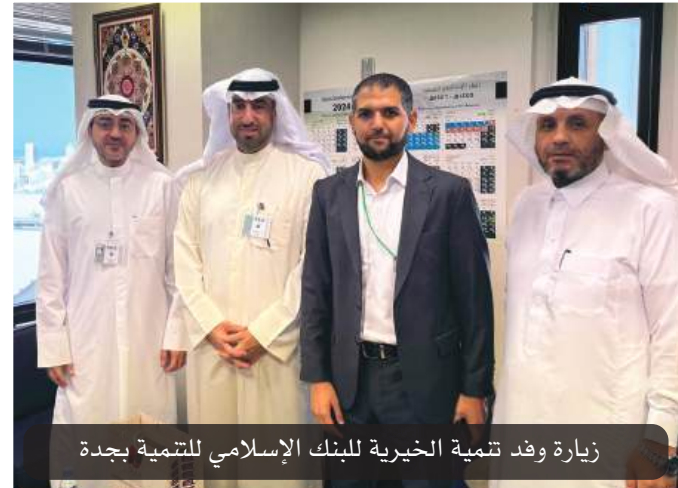
زيارة وفد تنمية الخيرية للبنك الإسلامي للتنمية بجدة