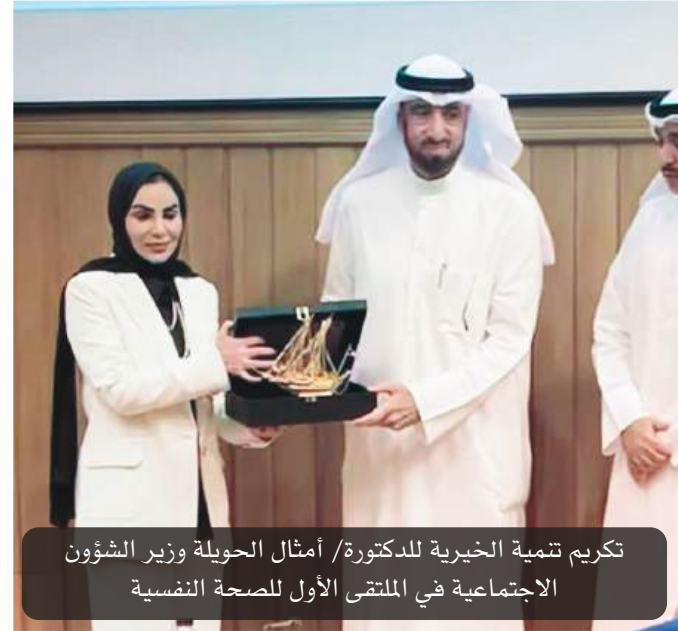
تكريم تنمية الخيرية للدكتورة/ أمثال الحويلة وزير الشؤون الاجتماعية في الملتقى الأول للصحة النفسية