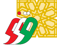
الأمانة العامة للأوقاف

رئيساً وفقاً إلى أن التعاون بين الجمعية والجهات الحكومية يعزز من دور العمل الخيري والإنساني الكويتي في خدمة المجتمع. وأشار الجمعي إلى أن جمعية تنمية الخيرية تتطلع إلى توسيع نطاق مشروع مستقبلاً يشمل مزيداً من الطلاب والطالبات، مع استمرار التعاون مع الأمانة العامة للأوقاف لتوفير الدعم اللازم لضمان نجاح المشروع وتحقيق أهدافه السامية.