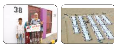
من قرى تنمية الخيرية باليمن

تشرت شبكة Al-Naba عن مبادرة «Interaction» التي أطلقتها منظمة «تنمية الخيرية» في اليمن. وتهدف المبادرة إلى توفير الدعم المالي لبرامج تنمية الخيرية التي تستهدف الأطفال في مختلف المناطق. وأكد ناصر العجمي، مدير عام تنمية الخيرية، أن هذه المبادرة تأتي في إطار التزام المنظمة بدعم العمل الإنساني في السودان، خاصة في مجال رعاية الأطفال والمعوين. وأضاف أن منظمة «اليونيسيف» ستعمل على تعزيز قدرات العاملين في تنمية الخيرية، وتوفير الموارد اللازمة لتنفيذ البرامج بشكل فعال. كما ستعمل على مراقبة وتقييم البرامج بشكل دوري لضمان جودتها وفعاليتها.