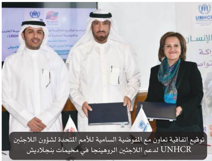
توقيع اتفاقية تعاون مع المفوضية السامية للأمم المتحدة لشؤون اللاجئين UNHCR لدعم اللاجئين الروهينجا في مخيمات بنجلاديش