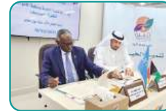
جانب من توقيع المذكرة