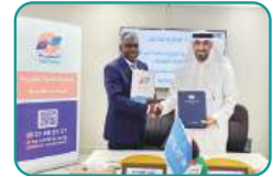
اليونيسيف وقعت مذكرة تفاهم مع تنمية الخيرية