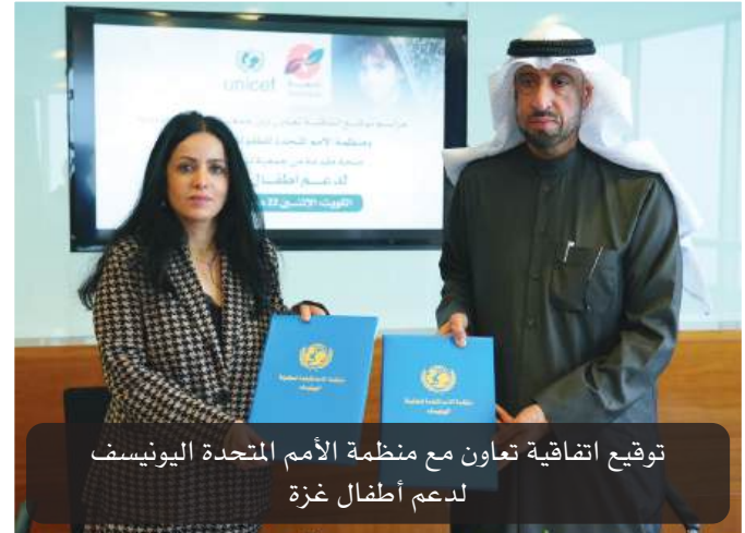
توقيع اتفاقية تعاون مع منظمة الأمم المتحدة اليونيسف لدعم أطفال غزة