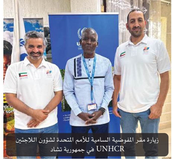
زيارة مقر المفوضية السامية للأمم المتحدة لشؤون اللاجئين في جمهورية تشاد UNHCR