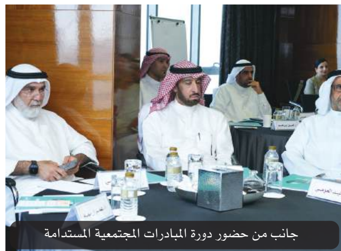
جانب من حضور دورة المبادرات المجتمعية المستدامة