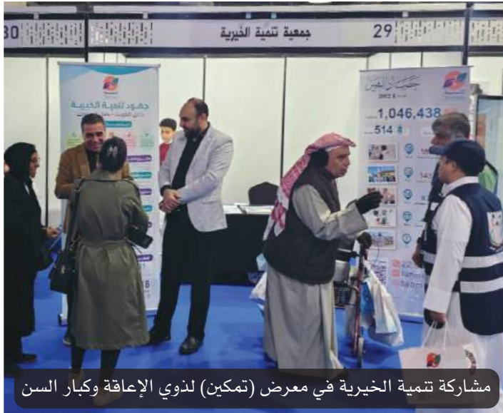
مشاركة تنمية الخيرية في معرض (تمكين) لذوي الإعاقة وكبار السن