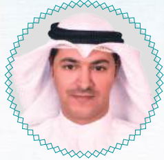
أ. مساعد قنيفذ الوعلان عضو مجلس الإدارة