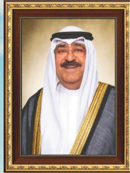
صَاحِبُ السُّمُو الشَّيْخِ مَنْشُورُ بْنُ أَحْمَدَ الْجَابِرِ السَّابِغِ أَمِيرُ دَوْلَةِ الْكُوَيْتِ