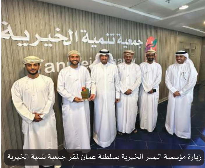
زيارة مؤسسة اليسر الخيرية بسلطنة عمان لمقر جمعية تنمية الخيرية