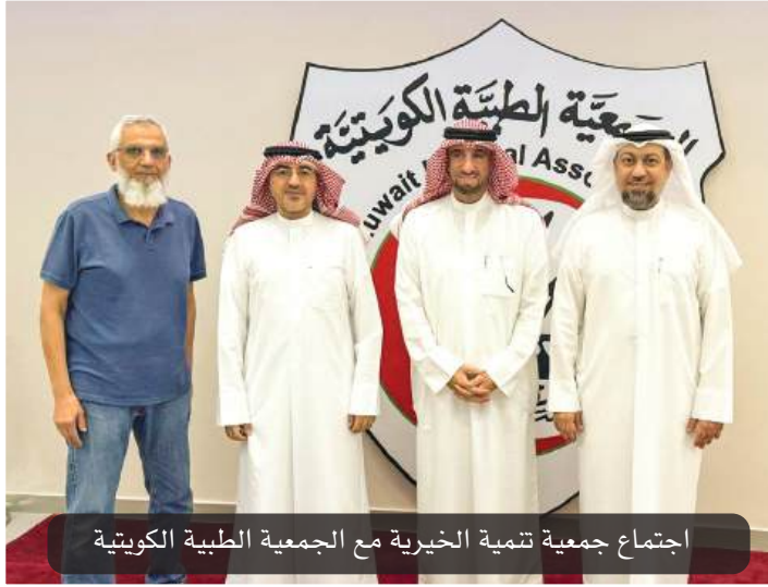
اجتماع جمعية تنمية الخيرية مع الجمعية الطبية الكويتية