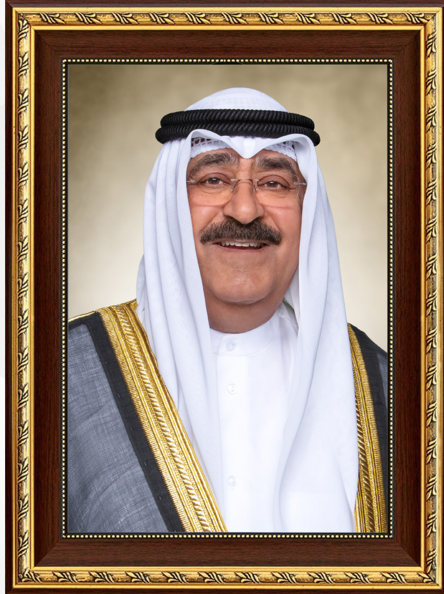
سمو الشيخ مشعل الأحمد الجابر الصباح ولي عهد دولة الكويت H.H. Sheikh Meshal AL-Ahmad Al-Jaber Al-Sabah The Crown Prince Of The State Of Kuwait