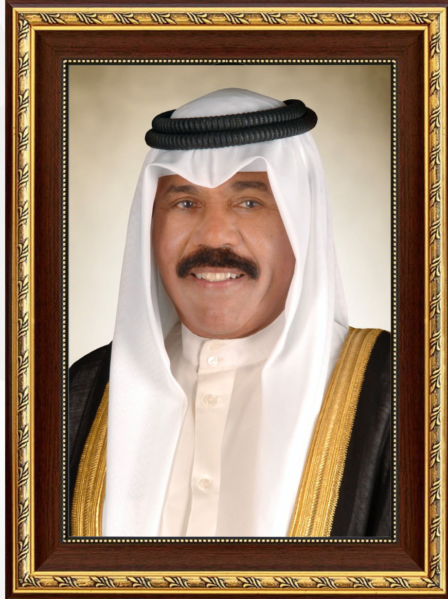
حضرة صاحب السمو الشيخ نواف الأحمد الجابر الصباح أمير دولة الكويت

H.H. Sheikh Nawaf AL-Ahmad Al-Jaber Al-Sabah The Amir Of The State Of Kuwait